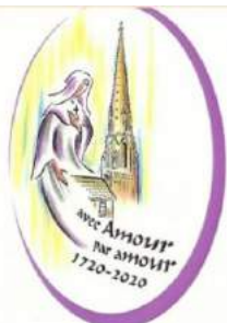
Tricentenaire de l'arrivée de Marie-Louise de Jésus à Saint-Laurent-sur-Sèvre