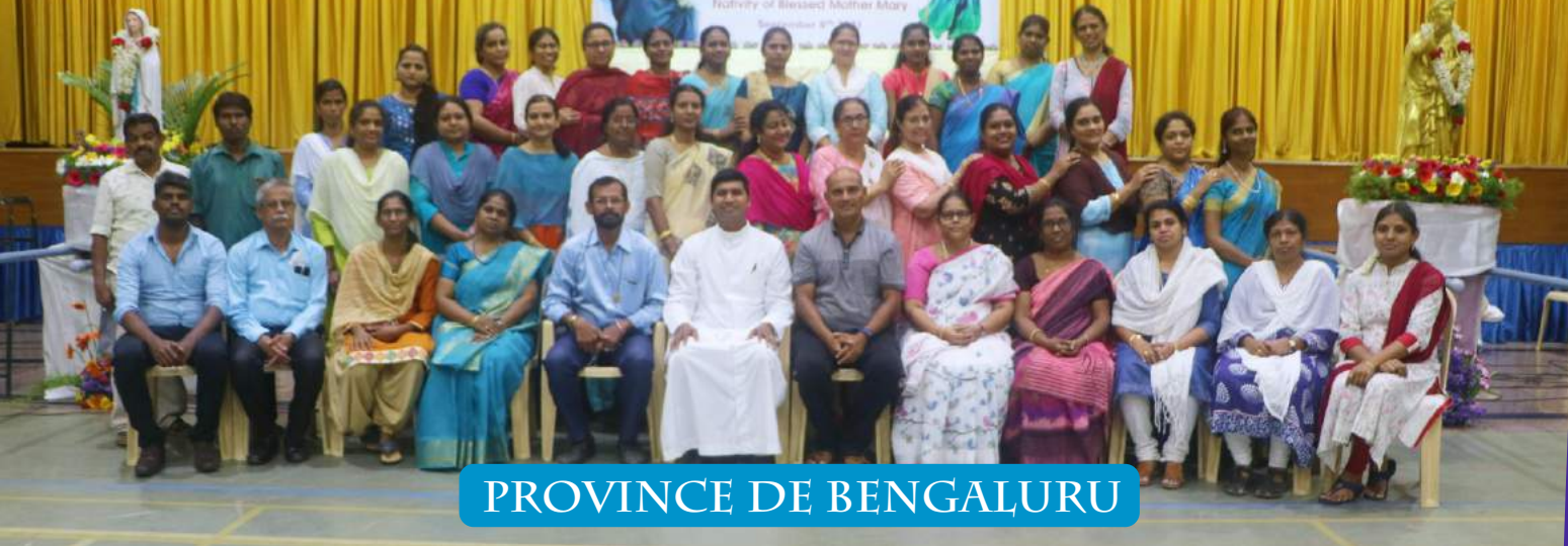
PROVINCE DE BENGALURU

“ Le Fils de Dieu s'est fait homme pour notre Salut mais seulement en Marie et par Marie.” – St Louis de Montfort