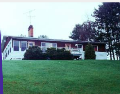
Chalet Ste Geneviève