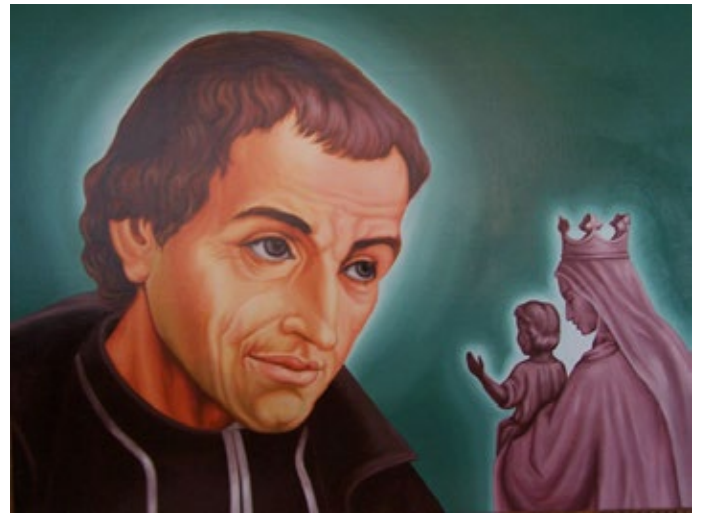
St. Louis Marie Grignion de Montfort (1673-1716)

Lorsque la guerre civile a éclaté, la persécution religieuse était déjà bien avancée, et ce 18 juillet 1936 n'est que la mèche qui a allumé le feu de haine et de violence qui brûlait sous la cendre. Nos Frères de Saint Gabriel ont essayé de sauver ce qui pouvait l'être, car leur seul but était de répandre le Royaume de Dieu et c'est pourquoi ils n'étaient actifs dans aucun parti politique. Ils étaient loin du militantisme sous toutes ses formes. Leur seule action a été apostolique. Cependant, le simple fait d'exister et d'être représentants du Christ et son Église était une source de haine exaspérée. Personne n'a pu opposer la moindre résistance à cela. La seule option face à la persécution était de fuir. Mais même cette option s'est avérée être temporaire et de courte durée. Lorsque les différentes communautés de la congrégation réparties dans toute la Catalogne ont été soumises à la cruauté et à la violence, avec la destruction des images sacrées, la profanation des églises et la confiscation de documents "compromettants", les Frères ont spontanément cherché refuge dans les maisons des familles amies. Lorsque la situation est devenue de plus en plus dangereuse pour la sécurité de leurs