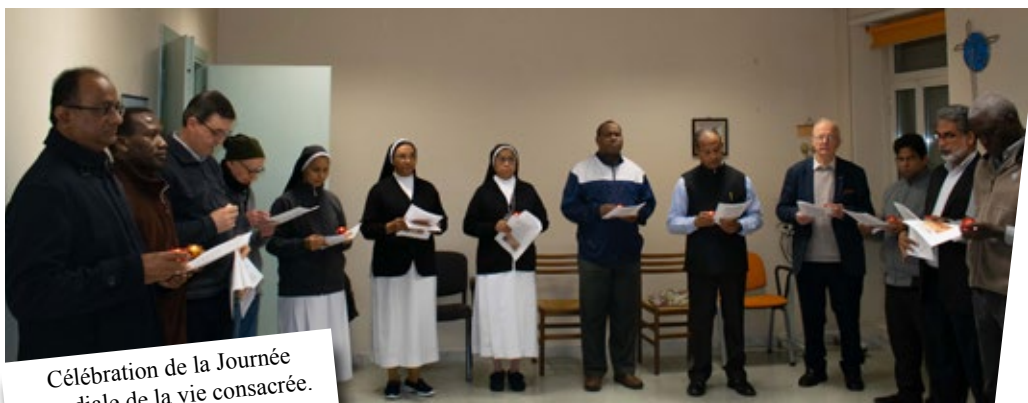
Célébration de la Journée mondiale de la vie consacrée. Généralat, Rome.