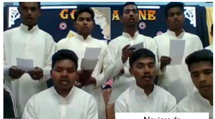
Novices de Noviciat Saint-Gabriel.