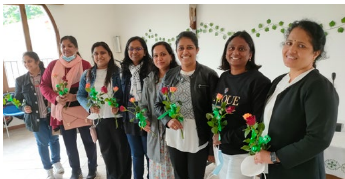
La communauté indienne catholique syro-malabar célèbre régulièrement une messe dans notre Institution. Ils ont également célébré la fête des mères.