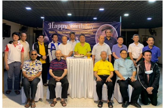
Commémoration de l'anniversaire de notre Supérieur provincial