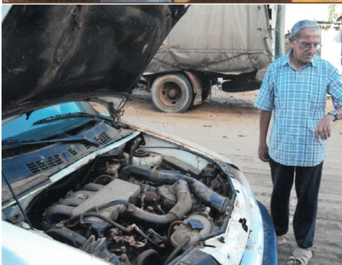
... voiture en panne à Malika... il faut un peu de temps pour attendre la réparation... La patience est de rigueur !!!