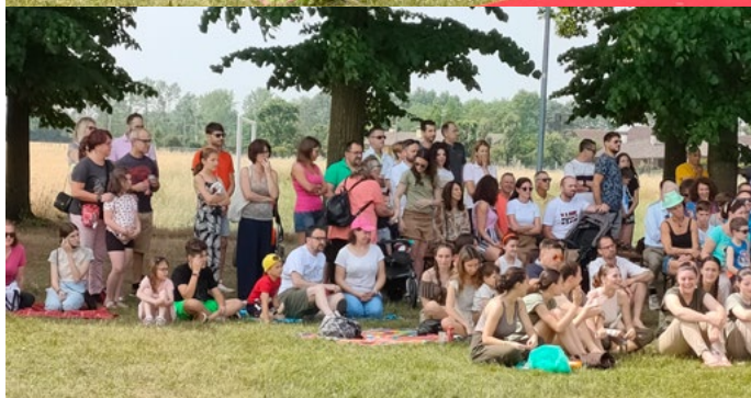
Les 4 et 5 juin, nous avons eu une cérémonie de clôture annuelle d'environ 400 étudiants en danse. Ce furent de merveilleuses journées de danse pour les élèves, leurs professeurs et leurs parents. Le programme s'est déroulé à l'extérieur dans les prés et la spectaculaire allée de tilleuls.