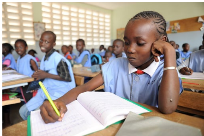
Les enfants de l'école à Malika