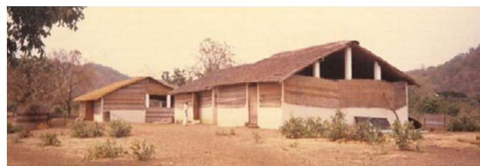
Centre de formation au développement agricole de Salémata construit grâce aux dons de Misereor, œuvre gérée par l'Église catholique en Allemagne.

Dans les années 70, nous avons été bloqués dans ce travail de formation par plusieurs années de grande