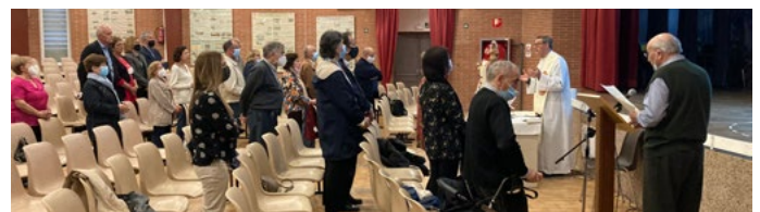
Célébration eucharistique - AGMONT - Barcelone