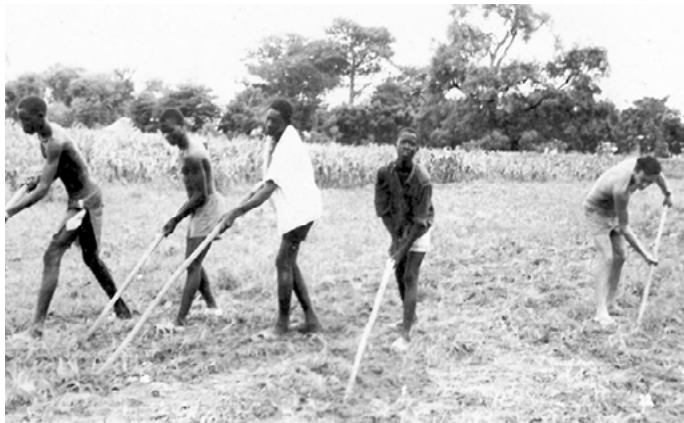
A Bambey, les jeunes qui travaillaient avaient une devise : «la joie et les chants»