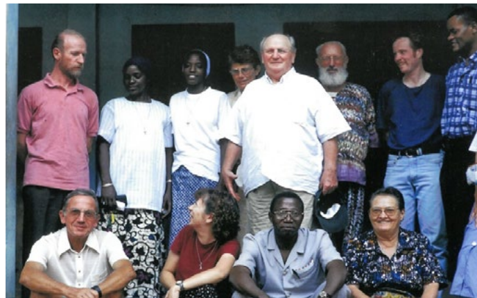
Les équipes apostoliques des paroisses à Salémata, Ourous et Koundara

sécheresse, qui n'étaient pas incitatives pour les jeunes chez eux. Plusieurs ont pu accompagner bon nombre de personnes de leurs villages en migration vers le fleuve Gambie pour retravailler, et se réinstaller. A cause de la sécheresse aussi, nous avons dû quitter Bambey en 1978. C'est alors que le centre a été repris par la Caritas de Thiès, qui avait lancé une opération de forage plus au sud. Ils ont utilisé le centre pour faire faire des stages aux gens des environs de ces forages, et pour y faire du maraîchage et des petits élevages.